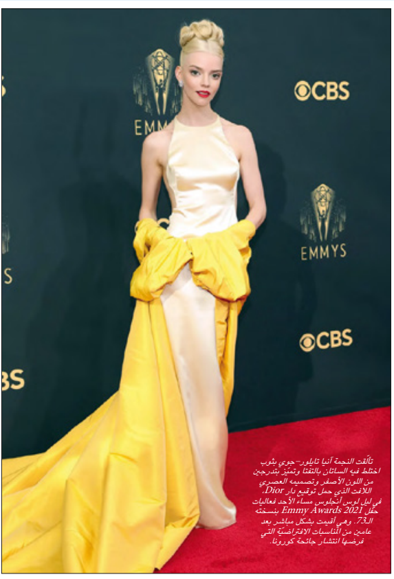
وأقت النجمة آسيا تاكوري -جوي شوب احتفال في الساتر، بالفتا وتمنح تدرج من اللون الأصفر وتصميمه العصري، الألات التي حمل توقيع دار Dior في ليل لوس أنجلوس مساء الأحد فعاليات حفل Emmy Awards 2021 بنسخته الـ73، وهي أقيمت بشكل مباشر بعد عامين من المناسبات الافتراضية التي فرضها انتشار جائحة كورونا

قالت المتحدثة باسم هيئة الحفاظ على الطبيعة في جنوب أفريقيا، لورين هوارد كلايتون، لوكالة الأنباء الألمانية، أمس الإثنين، إن هناك 64 بطريقاً من البطاريق التي يرجح أنها أقت حتفها بسبب سرب من النحل، في مدينة كيب تاون السياحية بجنوب أفريقيا. وتم العثور على الطيور النافقة، يوم الجمعة الماضي على شاطئ «بولدرز»، وهو مقصد سياحي شهير يقع جنوب كيب تاون.