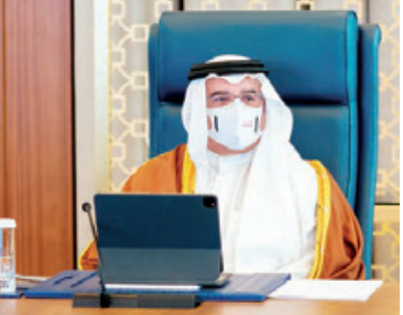
سمو ولي العهد رئيس الوزراء خلال ترؤسه جلسة مجلس الوزراء.

استعرض مجلس الوزراء ملخصاً حول أداء عدد من المؤشرات الاقتصادية التي تباينها وزارة المالية والاقتصاد الوطني بشكل دوري وتعكس استمرار وتيرة التعافي الاقتصادي، إذ سجل عدد من المؤشرات الاقتصادية خلال عام ٢٠٢١ إشارات إيجابية المسجلة في عام ٢٠١٩ قبل الجائحة. جاء ذلك خلال جلسة مجلس الوزراء أمس برئاسة صاحب السمو الملكي الأمير سلمان بن حمد آل خليفة ولي العهد رئيس مجلس الوزراء. في الشق العقاري ارتفع عدد رخص البناء الصادرة في الأشهر الثمانية الأولى من عام ٢٠٢١ بنسبة ٢١٨ عن الفترة ذاتها في ٢٠١٩، وتجاوز عددها في شهر أغسطس الماضي المستويات المسجلة في شهر أغسطس ٢٠١٩ بنسبة ٦٢٤٪. وتجاوزت مستويات المبيعات عند