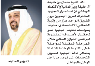
أخبار البحرين | ٣ ص