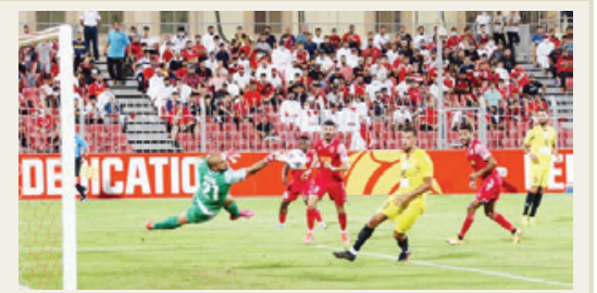
ثلاثية نظيفة تعود المحرق إلى نهائي بطولة غرب آسيا.